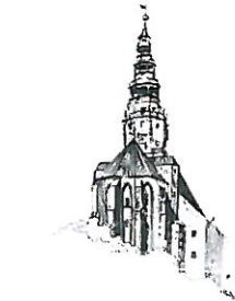
Kościół pw. Św. Stanisława i Św. Wacława Katedra Diecezji Świdnickiej